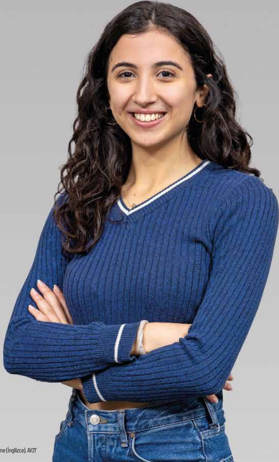
Bahar Boğaziçi Üniversitesi, İşletme (İngilizce), AV21

Kırk beşinci yılımızda, kuruluşumuzdan bugüne Türkiye'nin 81 ilinden, mühendislikten tıba, temel bilimlerden sanata kadar, hemen her bölümde öğrenim gören 30 binin üzerinde öğrenciye destek sağladık.