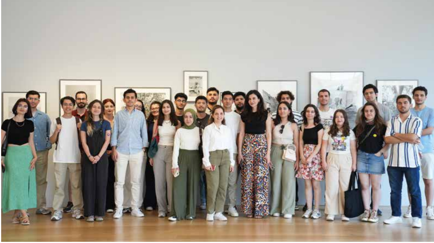
Arter Müzesi Ziyareti Visit to Arter Museum