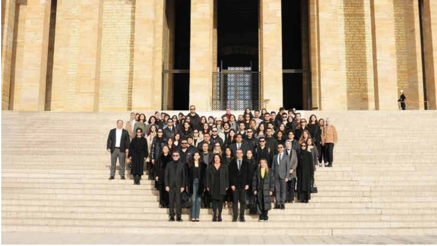
Anıtkabir Ziyareti Visit to Anıtkabir