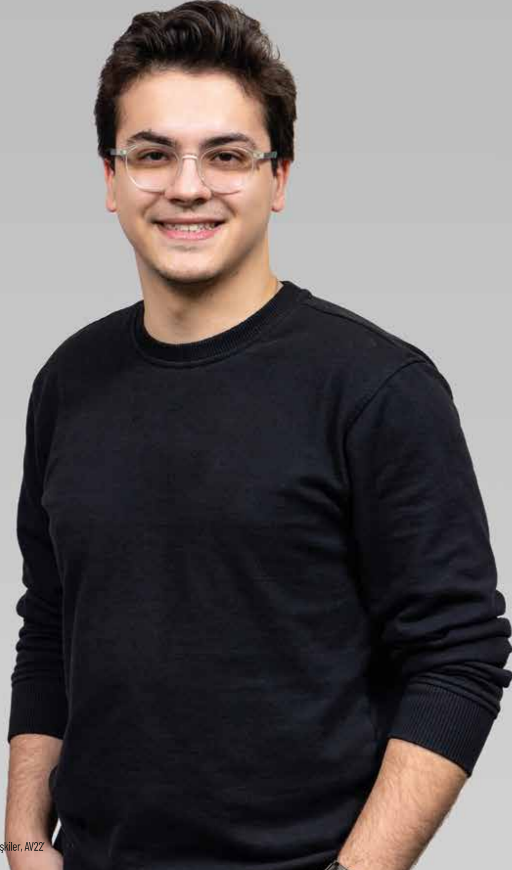
Kadir Marmara Üniversitesi, Uluslararası İlişkiler, AY22

Coaching Program / English Training Program