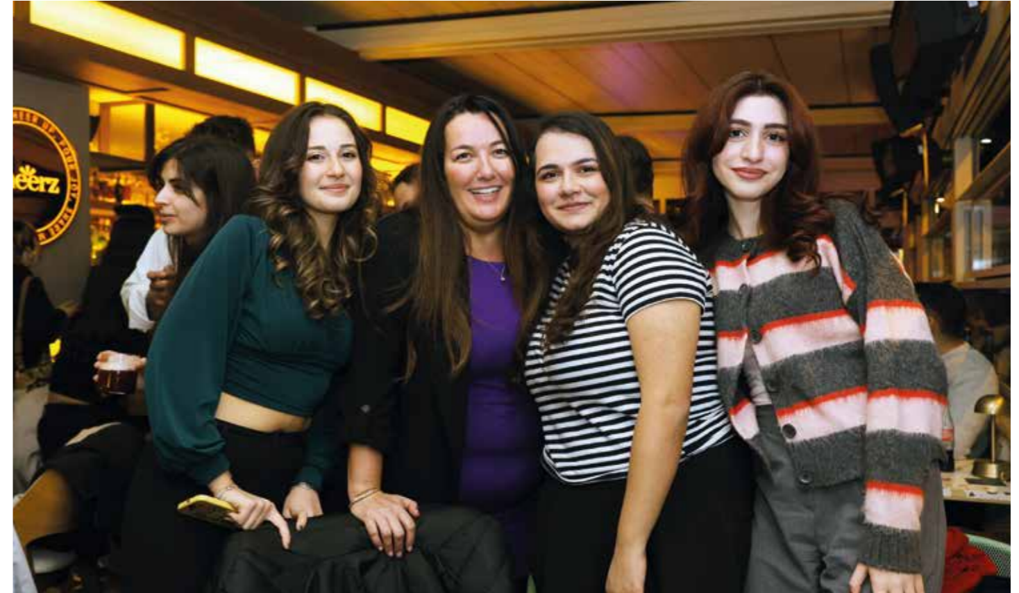
Yılbaşı Partisi New Year's Eve Party